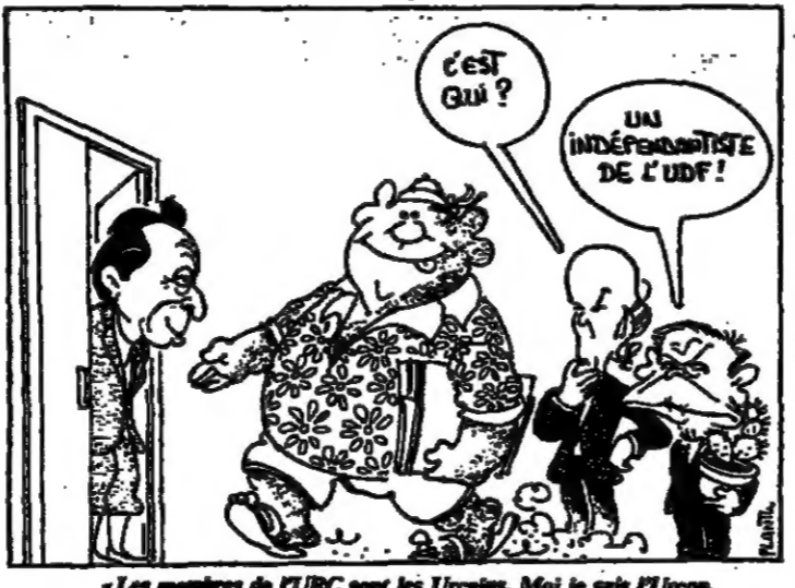
« Les membres de l'URC sont les Français. Moi, je suis l'URC. » (Dessin paru dans le Monde du 18 juin.)